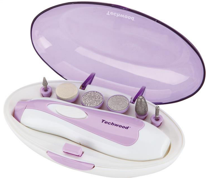
TMA-44 ET TMA-54

عزيزي المستخدم ، قبل الاستخدام لأول مرة ، اقرأ هذه التعليمات للاستخدام وفقاً لتعليمات السلامة وتعليمات الاستخدام. أبلغ المستخدمين المحتملين بهذه التعليمات. احتفظ به للاستخدام لاحقاً. قم بفك عبوة الجهاز مع الاحتفاظ بكافة العبوات